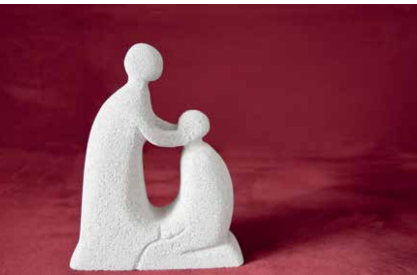
Symbolhafte Darstellung der Krankensalbung

Einladung zur Feier und zum Empfang des Sakraments der Krankensalbung.