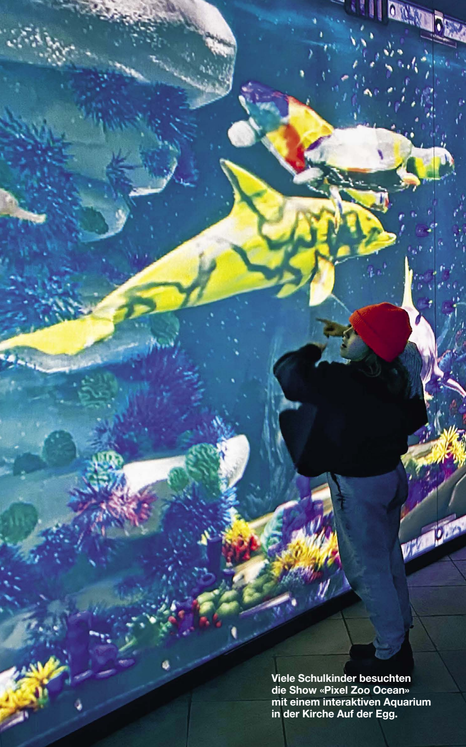
Viele Schulkinder besuchten die Show «Pixel Zoo Ocean» mit einem interaktiven Aquarium in der Kirche Auf der Egg.